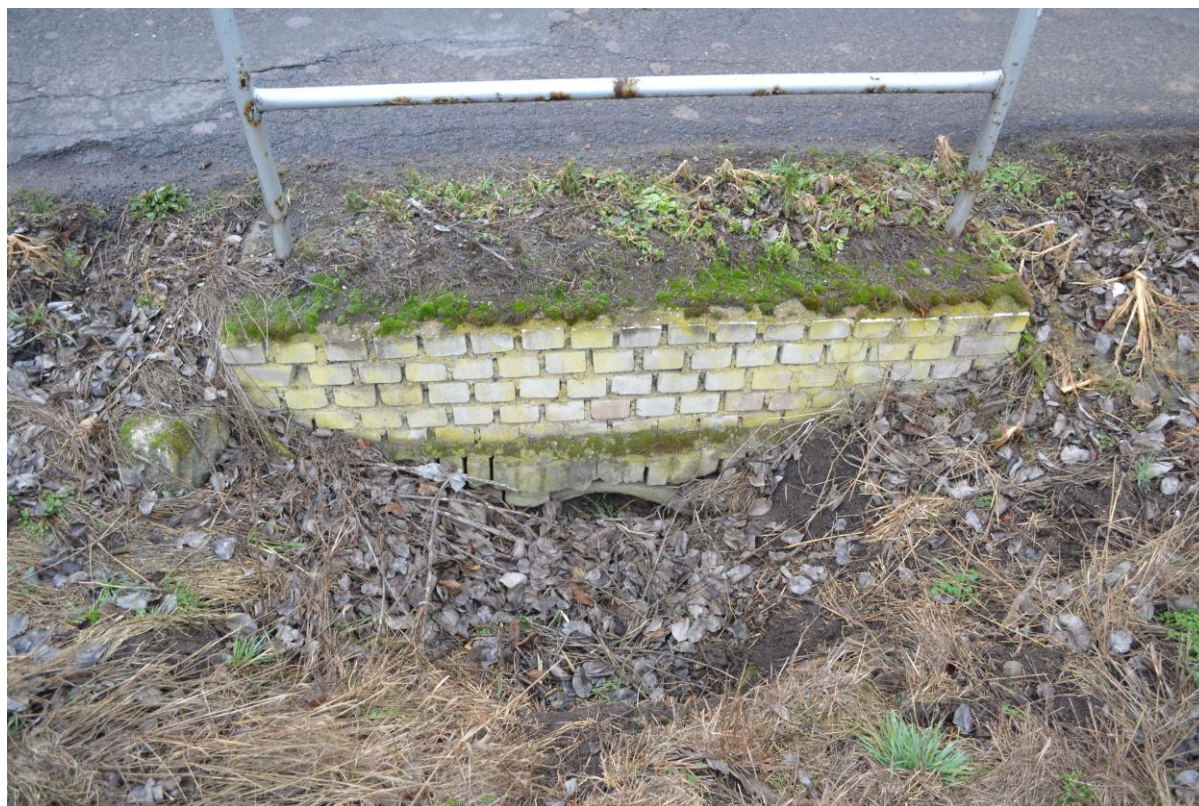
Pravá strana - vtok